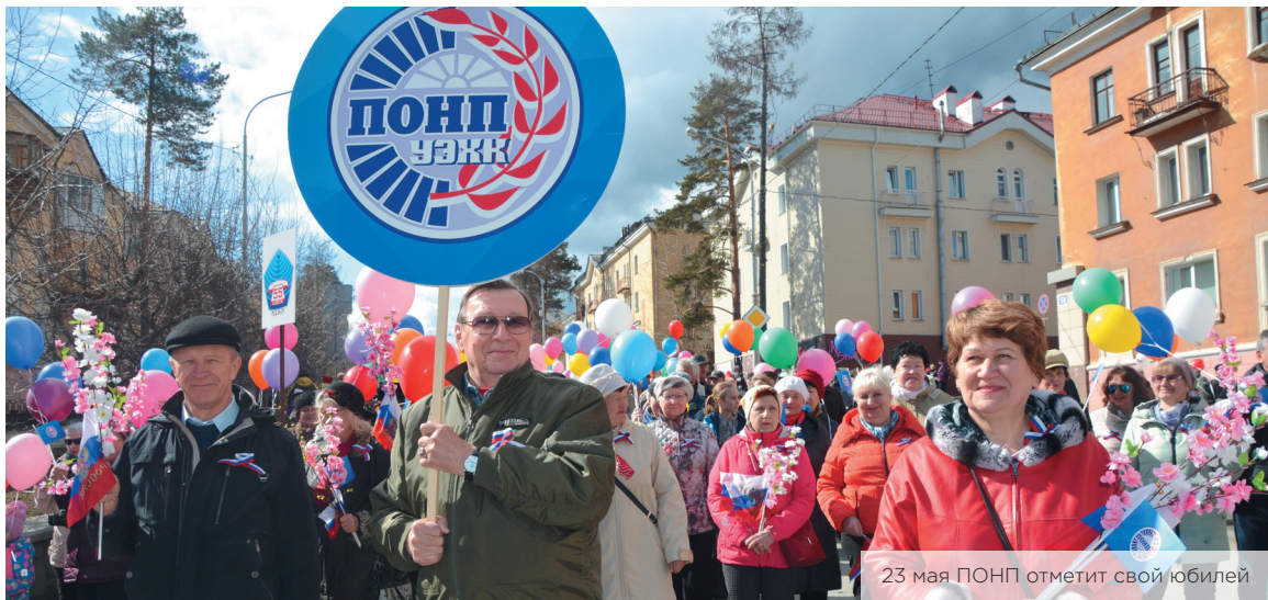
23 мая ПОНП отметит свой юбилей

Примите самые искренние поздравления и наилучшие пожелания в связи с 30-летием со дня образования Профсоюзной организации неработающих пенсионеров!