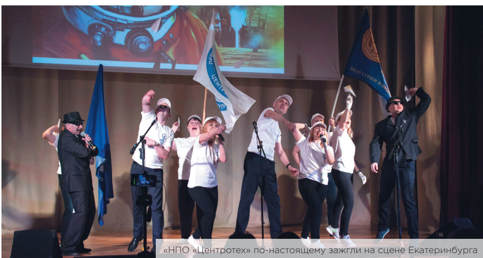
«НПО «Центротех» по-настоящему зажгли на сцене Екатеринбурга