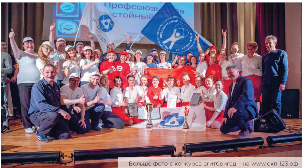
Большое фото с конкурса агитбригад – на www.okp-123.ru