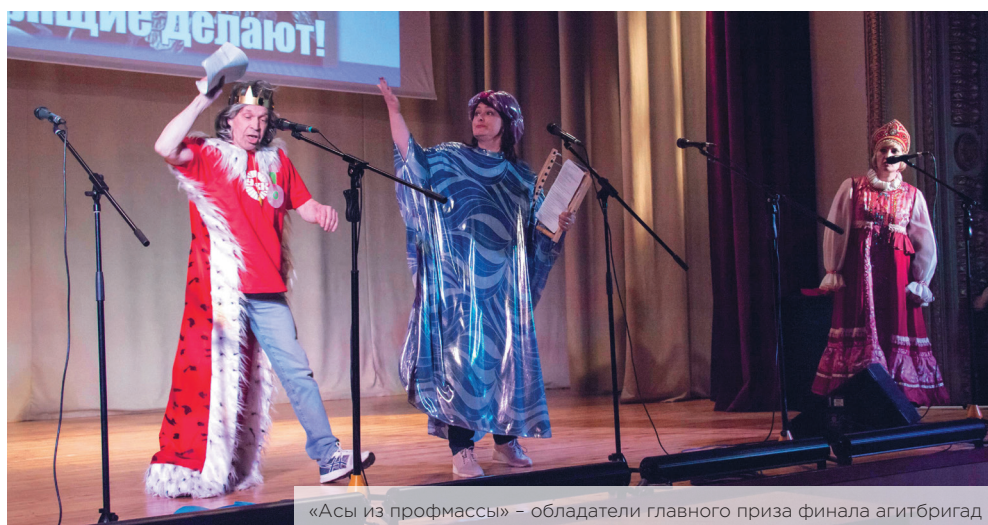
«Асы из профмассы» – обладатели главного приза финала агитбригад

24 апреля 4 новоуральские и 8 команд профсоюзов предприятий Курганской, Челябинской, Свердловской областей и Пермского края встретились в Екатеринбурге на XII Открытом Уральском конкурсе агитбригад «Профсоюзы за достойный труд!», курируемом Федерацией профсоюзов Свердловской области. Конечно, ключевые