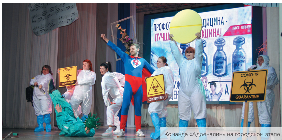
Команда «Адреналин» на городском этапе

Команда агитбригад ОКП-123 взяла гран-при на Уральском конкурсе